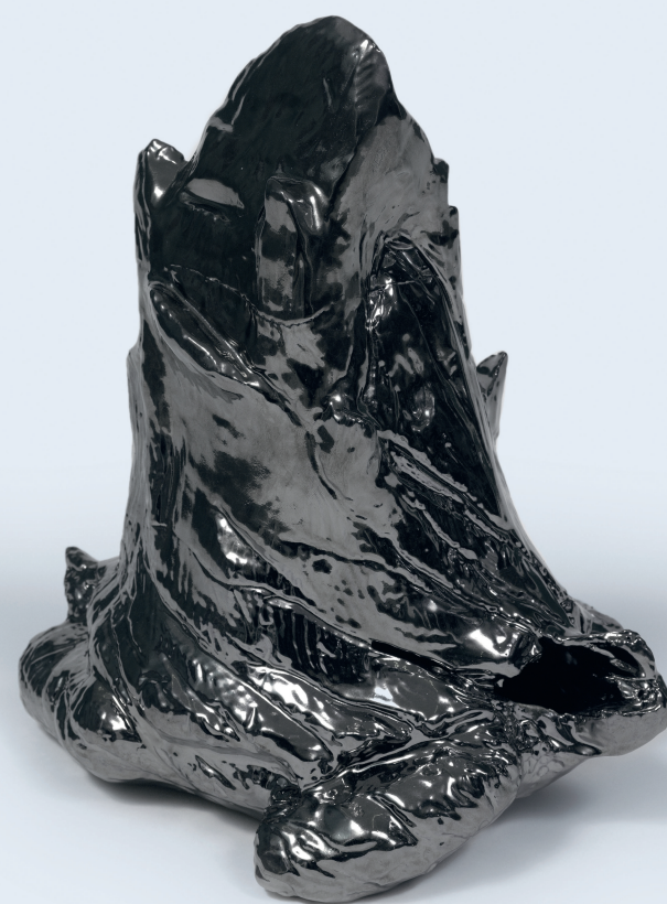
Couverture: Denis Savary, Fumée I, 2018 - Photo © Annick Werter

heart@geneva association artistique et philanthropique www.heartgeneva.ch